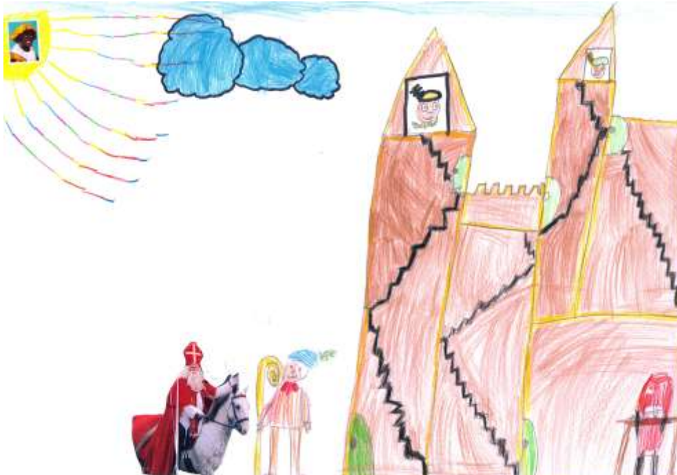
Tekening van Amber.